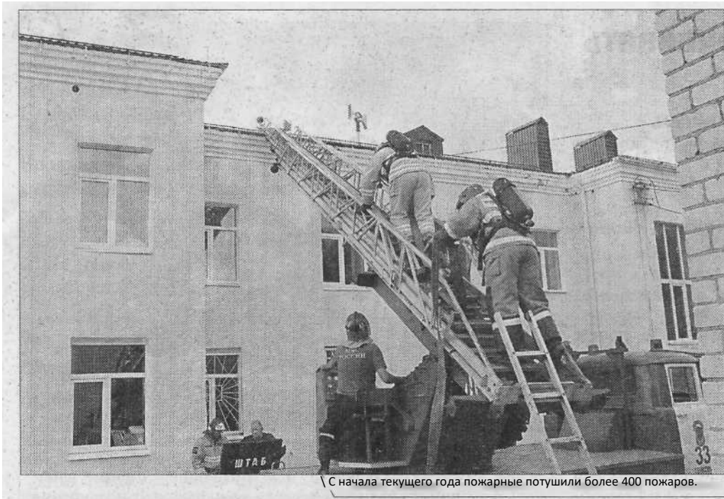
С начала текущего года пожарные потушили более 400 пожаров.