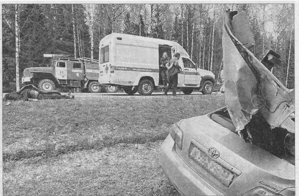
На ликвидацию последствий ДТП спасатели в этом году выезжали около 30 раз.